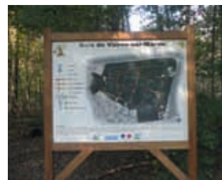
Bois de Vaires-sur-Marne

POUR L'ANNÉE 2015, VOICI LES PROJETS MUNICIPAUX QUE J'AI SOUHAITÉ ACCOMPAGNER :