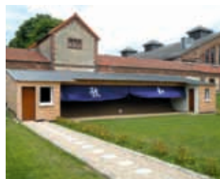
Kyudojo national de Noisiel