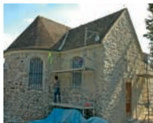
Rénovation de l'église Saint Baudile de Brou-sur-Chantereine

DEPUIS JUIN 2012, CHAQUE DÉPUTÉ(E) DISPOSE D'UNE RÉSERVE PARLEMENTAIRE IDENTIQUE DE 130 000 EUROS . L'UTILISATION DE CETTE RÉSERVE EST RENDUE PUBLIQUE.