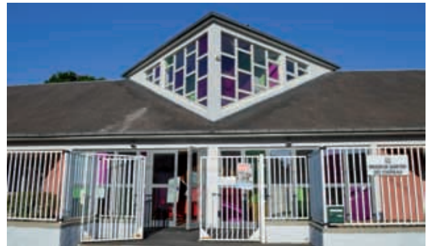
Espace Marcel Dalens de Chelles

• Les allocations familiales seront modulées en fonction des revenus. Aujourd'hui, les familles les plus aisées perçoivent les mêmes montants que les familles modestes. Moduler les allocations selon les besoins n'est ni plus ni moins qu'une mesure de justice sociale. Toutes les familles continueront à percevoir des allocations mais les plus aisées en toucheront moins.